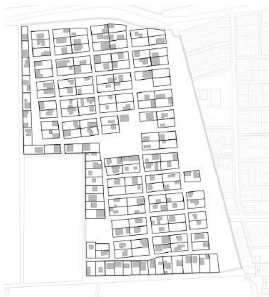
Figura 3: Zenteno Lepe, Lucas (2024) Levantamiento de la Toma 17 de mayo en función del mapeo elaborado por la Cooperativa Kincha.

La toma de terreno se efectuó el 17 de Mayo del 2019. “En nuestros cinco años de existencia, nos hemos dado un lugar digno para vivir con nuestro propio esfuerzo, construyendo nuestras viviendas en un terreno que hasta entonces era un sitio eriazos y un basural. Un terreno que transformamos en el espacio de vida de nuestra comunidad.” 13 La planificación inicial ha logrado responder bien a las necesidades de cada familia y a la instalación de servicios básicos como agua y luz. La distribución es excepcional en orden y tamaño en comparación con otros asentamientos, ya que fue diseñada previamente a la ocupación definiendo lotes de 14x29 metros agrupados en manzanas de 4, con vialidades de 6-7 metros de ancho y espacios entregados para infraestructura comunitaria y de recreación (Fig. 3).