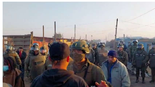
Figura 1: El desalojo de la Toma 17 de Mayo de, Cerro Navia, Región Metropolitana.